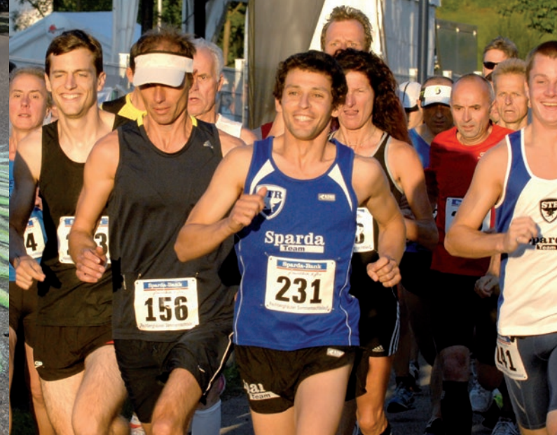
Sa 30. Juli – Sommernachtslauf