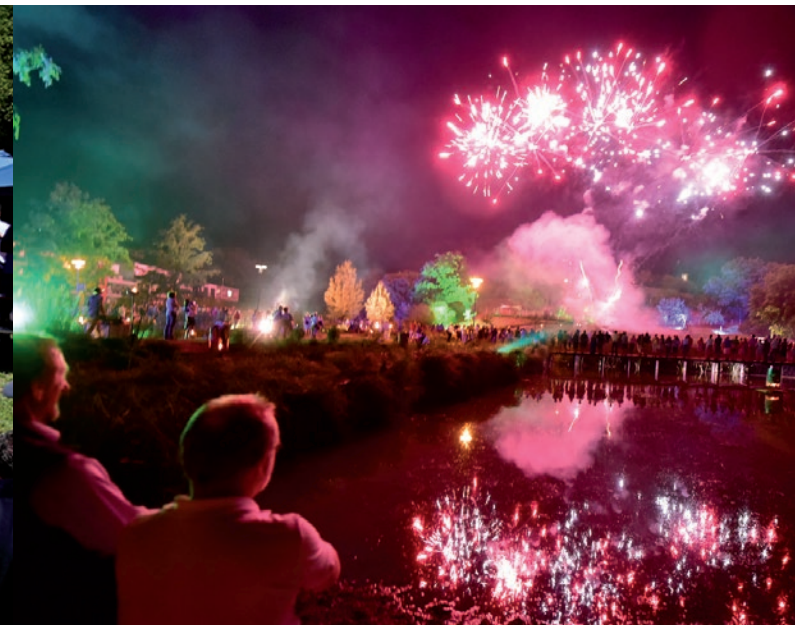
Sa 6. August – Sommernachtsfest