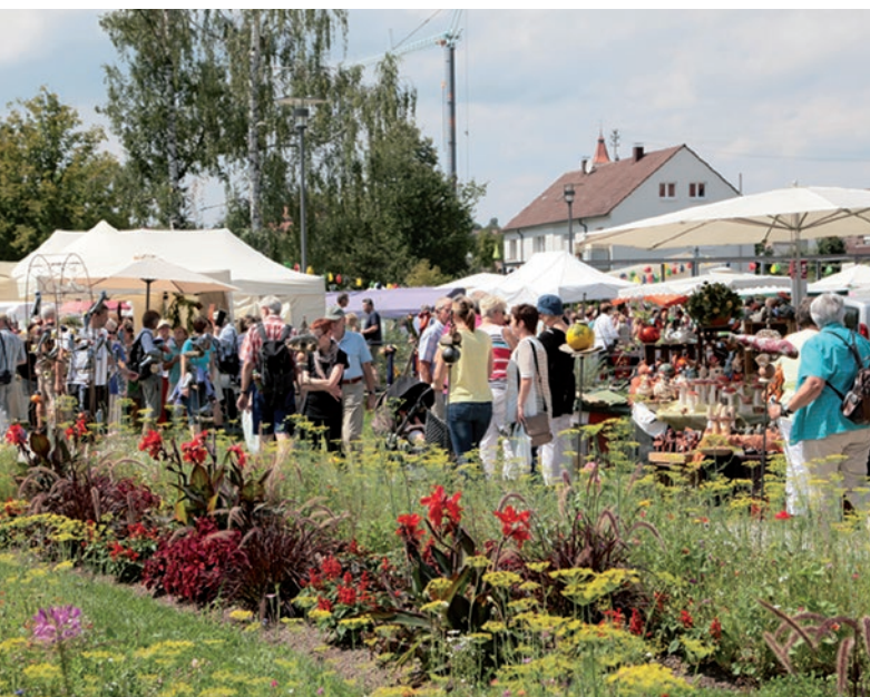
Sa + So 13./14. August – Gartenmarkt