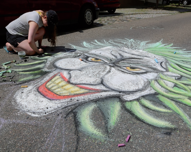
So 10. Juli – KreideZeit