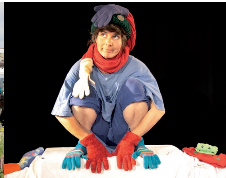
21. - 28. August – Kindertheaterwoche