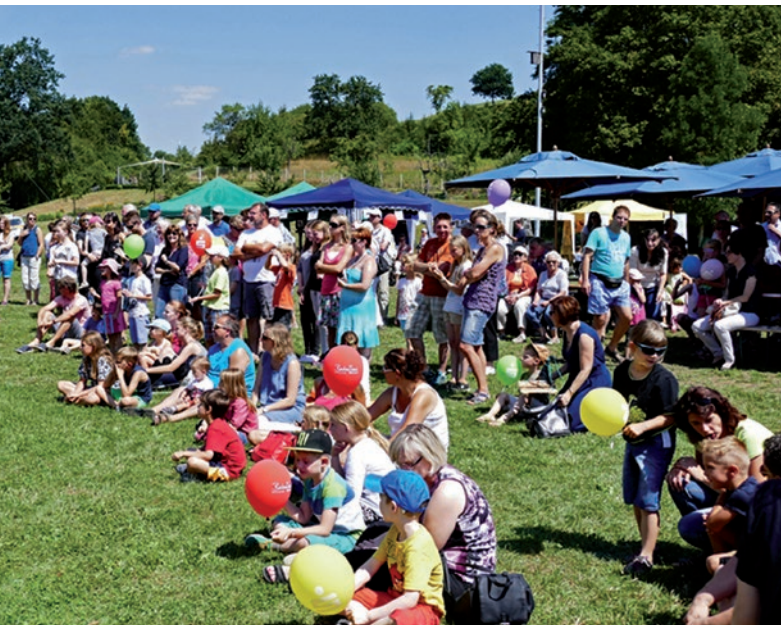
So 31. Juli – Familientag mit NWZ