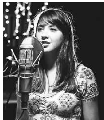
Miriam Ast

Eintrittskarten: 8 Euro (Schüler, Studenten) und 18 Euro